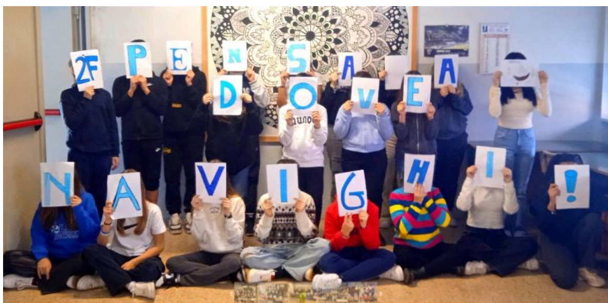
(non è possibile pubblicare tutte le belle fotografie inviate)